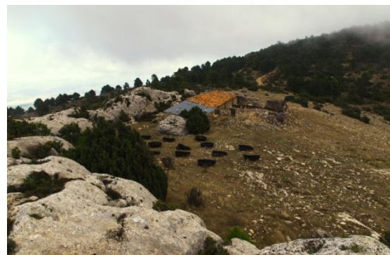
Vista de La Atalaya