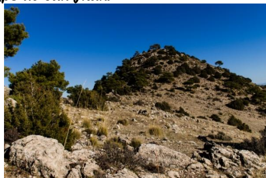
Vista de la cumbre del Castillico