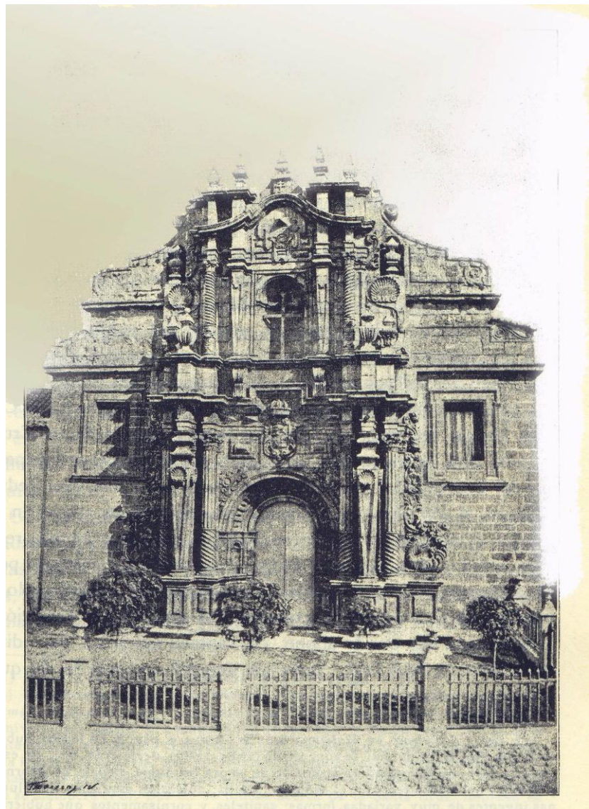
Fachada del Santuario – Programa de Fiestas de 1893