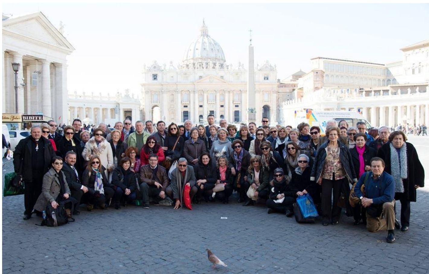
Grupo de peregrinos caravaqueños en la Plaza de San Pedro.