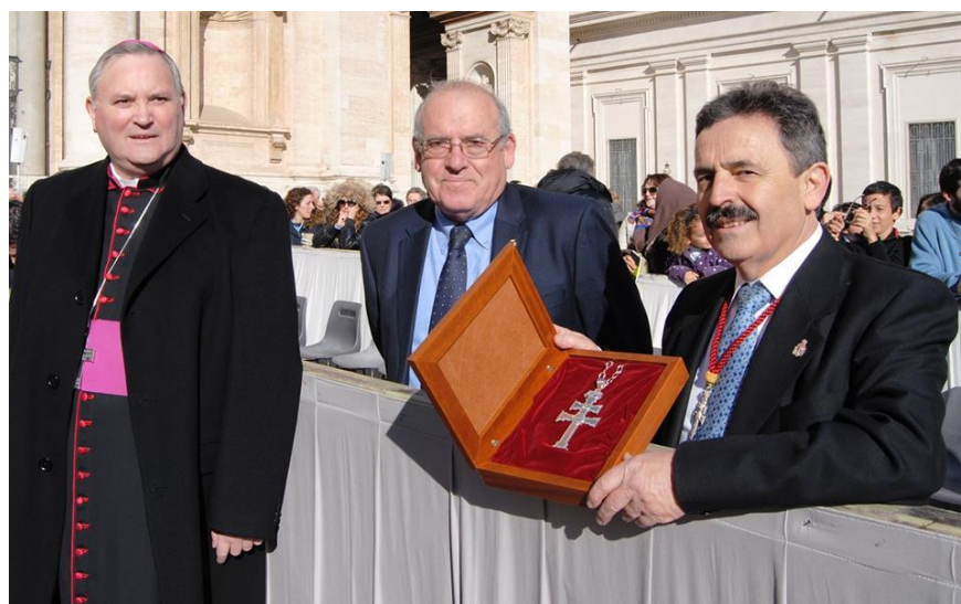
El Hermano Mayor muestra la cruz pectoral que le regaló al Papa Francisco.