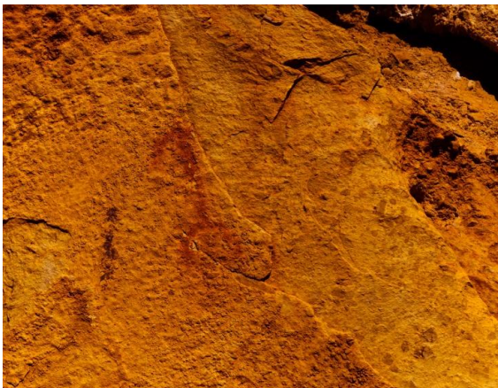
Pinturas rupestres esquemáticas